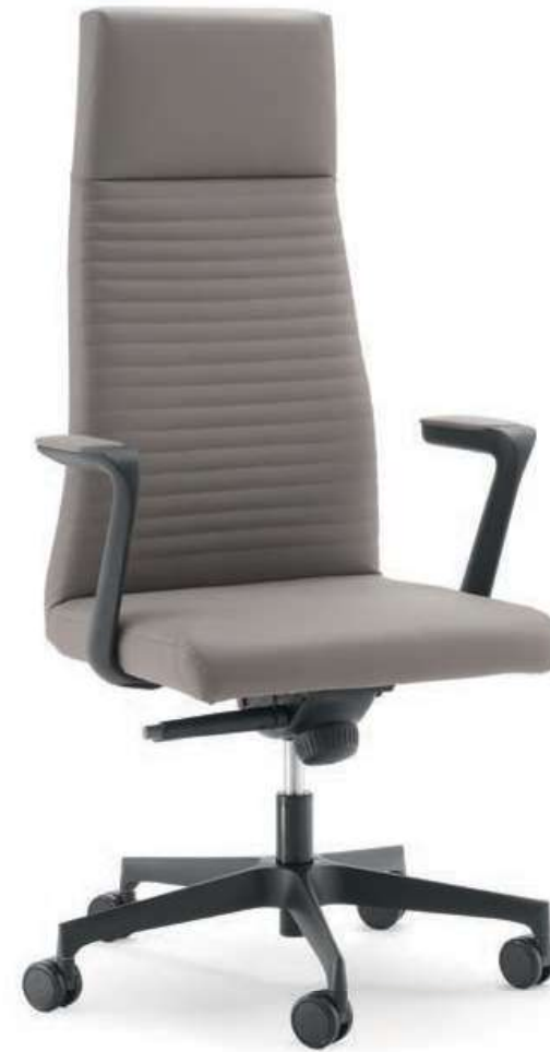
COD LC011A Schienale alto, braccioli in PU nero con top imbottito High back, black PU armrests with upholstered top